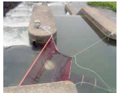
網による採捕調査