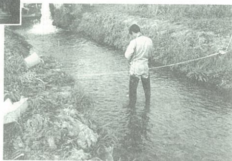
川茸の環境調査 (道路公団依頼)