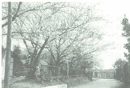
桜咲く4月の協会風景 (玄関前広場)