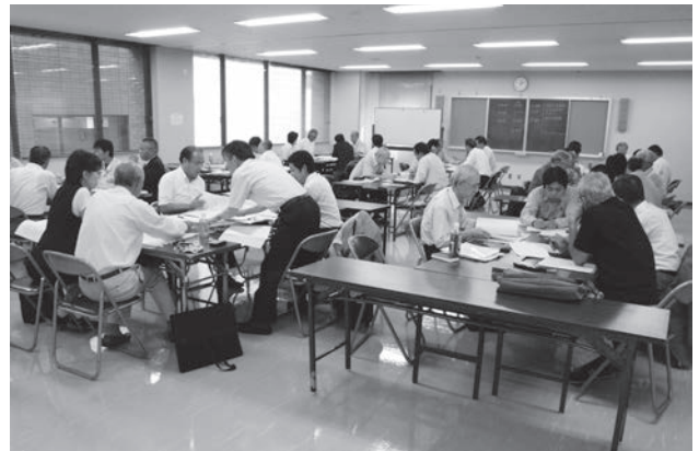
写真 E A 21導入セミナー風景(自治体,企業団体)