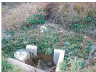
ソダ柵による濁水流入防止