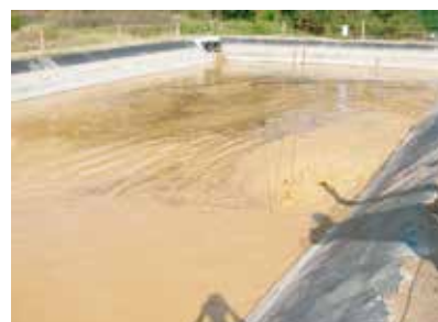
凝集剤による濁水処理