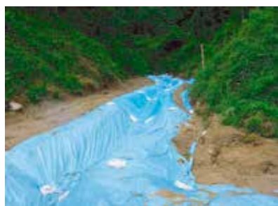
シートによる濁水発生防止

濁水を防止するためには，その規模や発生場所に適した安価で効果的な対策が望めます。