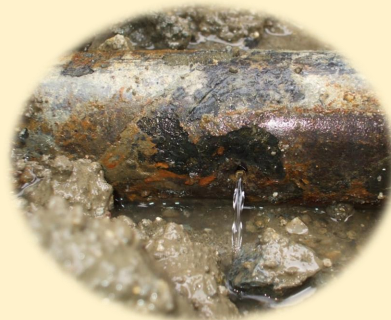
埋設下水配管の腐食による漏水

土壌の腐食性項目を分析することで、埋設配管劣化の予防保全に役立てることが可能です。