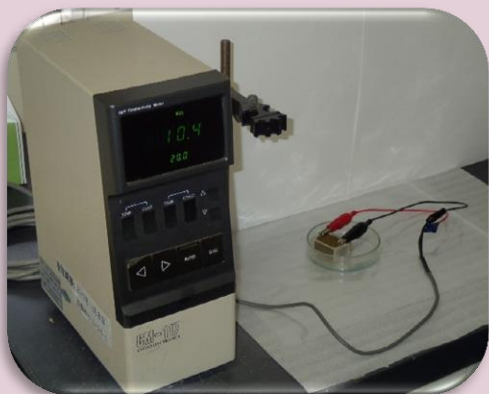
土壌比抵抗測定装置 〔ANSI評価項目〕

地中に埋設された水道管、下水道管等の金属性配管は重要なライフラインのひとつです。高度成長期に埋設された配管は老朽化が進んでおり強度低下や腐食による漏水や破裂が問題となっています。